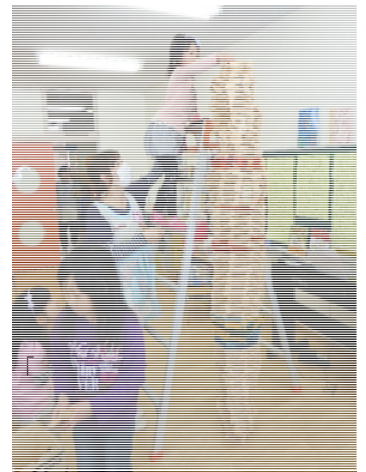
P T A で購入していただいたカプラで遊ぶ子供たち

本園では、まさにたくさんの生き生きとした体験活動を通して、感性を高め意欲を持たせる幼児教育を心掛けています。今日も、子どもたちは、汗をたくさんかいて、先生や友達と楽しく元気に遊んだり活動したりしています。