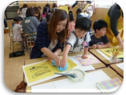
さくらんぼ組さんは、園長先生から 手作りのいたどり笛をもらいました。