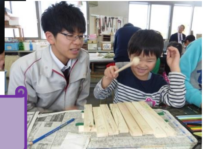
さくらんぼ組農業高校交流 木琴を作ったよ！！