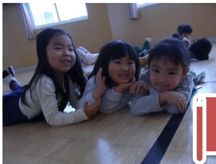
自由遊び、フリータイムでの様子