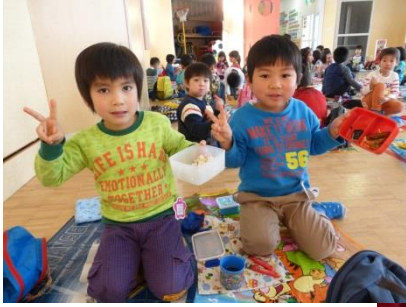
各学年交流遊びをしました！