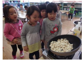
れもん組 さくらんぼ組とのお店屋さんごっこ