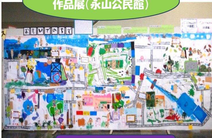
さくらんぼ組 おもいでのちず