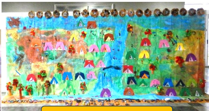
れもん組 あきのもいできゅんぷしろう