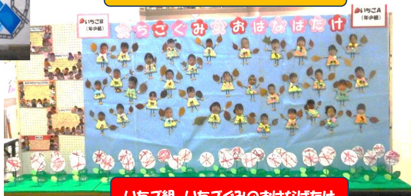
いちご組 いちごぐみのおはなばたけ